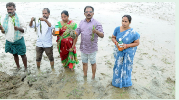
పచ్చని పైరును దున్ని నాశనం చేశారని రైతుల గోస...